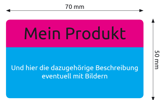
Druckdaten ohne Beschnittzugabe